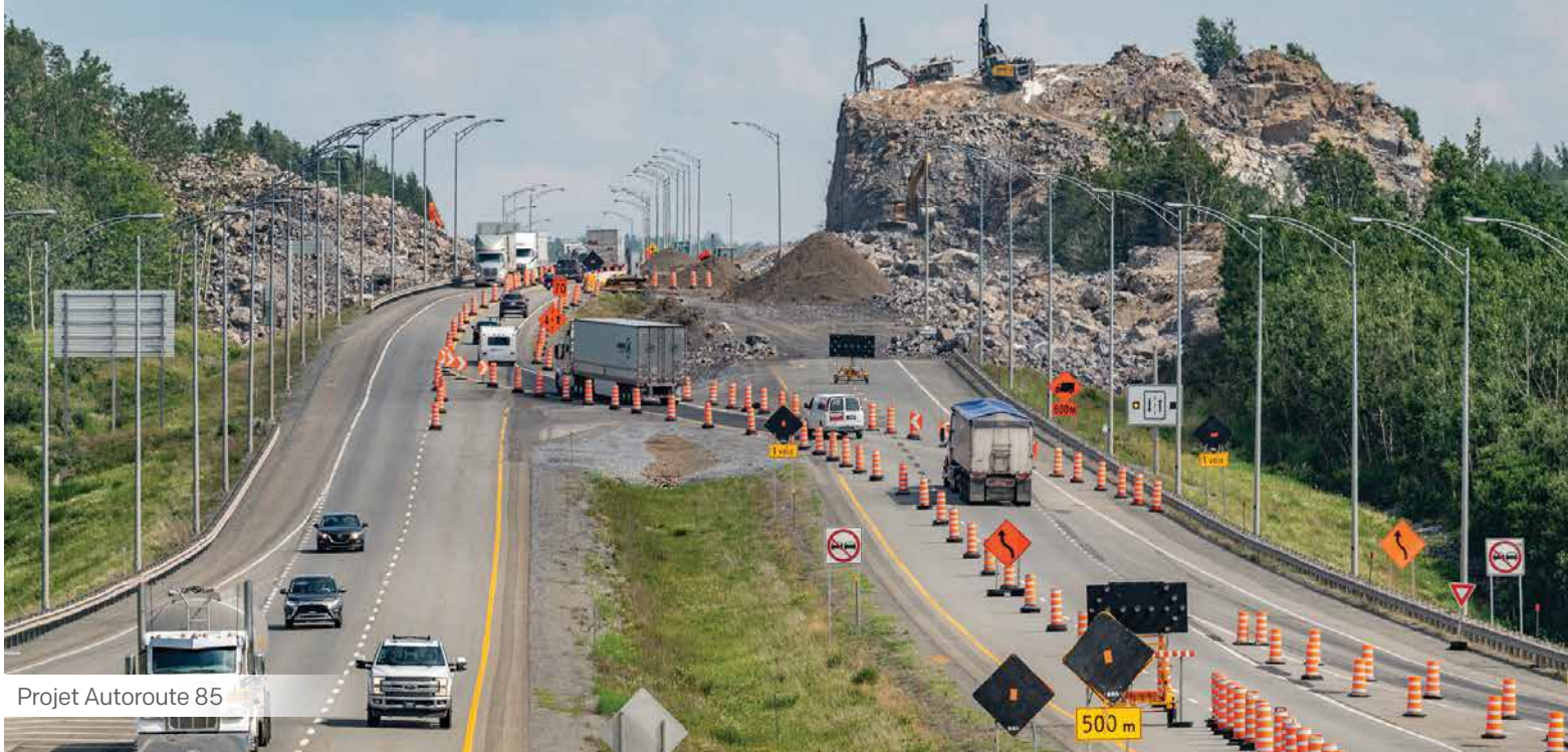
Projet Autoroute 85