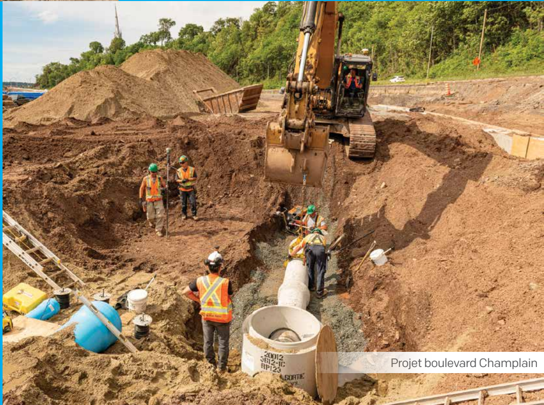
Projet boulevard Champlain

La qualité de nos travaux, le respect des délais et la satisfaction de nos clients sont nos priorités , le tout en travaillant de façon sécuritaire, proactive et dynamique, dans une ambiance partenariale pour la réussite de tous projets.