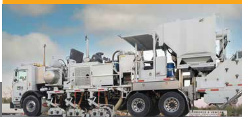
Équipement d'effacement mécanique

Lignco est un leader en marquage de routes, de chantiers de construction et de stationnement partout à travers le Québec. Lignco réalise des marquages au latex, à l'alkyde ainsi qu'à l'époxy . Tous ces produits sont homologués par le ministère des Transports (MTQ). Lignco possède de l'équipement de pointe pour l'effacement de longue distance de façon mécanique , ce qui en accélère grandement l'exécution.