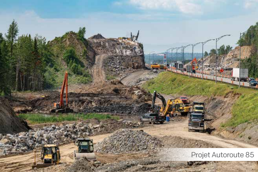
Projet Autoroute 85